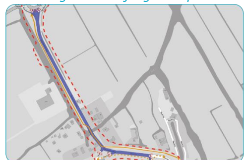
Figuur 3: Werkzaamheden fase 5