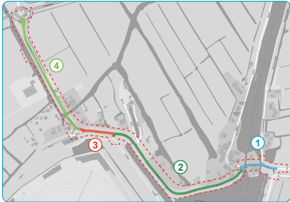
Figuur 1: Fasering